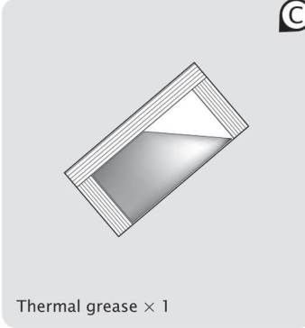
Thermal grease × 1