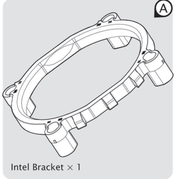
Intel Bracket × 1